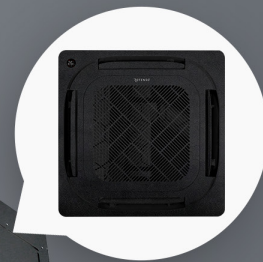
Optionalny, czarny panel